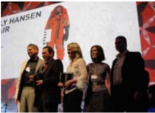
DESIGNDAGEN 2008 HADDE FOKUS PÅ DESIGN SOM INNOVASJONSDRIVER.

Avdeling for FoU og innovasjonsprogrammer har ansvaret for bygging av nye nettverk innen innovasjonsarenaen nasjonalt og internasjonalt, samordne spissede prosjekter som har en tydelig forankring i FoU og innovasjon, samt søke å etablere nasjonale og bedriftsrettede innovasjonsprogrammer med utgangspunkt i designmetodikk, sammen med øvrige partnere i virkemiddelapparatet. Dessuten virke til ny kunnskap i Norge om Designdrevet Innovasjon gjennom forskningsprosjekter og "benchmarking". Avdelingen har også et særskilt ansvar mht kontakt med NHD vedr. innovasjonsmeldingen