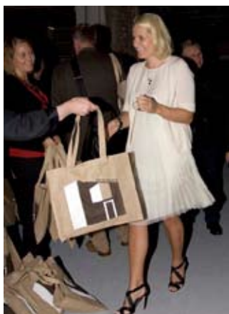
KRONPRINSESSE METTE-MARIT HOLDER ÅPNINGSTALEN FOR DEN NORSKE DESIGNUTSTILLINGEN 100% NORWAY, I LONDON.