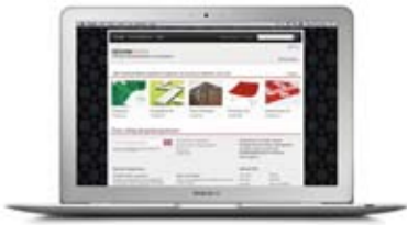
FORSIDEN - DESIGNBASEN.NO

Norsk Designråd har alltid hatt en oversikt over designere og designbyråer i Norge til internt bruk. Denne var etter hvert blitt utdatert og et prosjekt ble startet opp for å utvikle en ny, elektronisk database. Prosjektet ble startet opp sammen med daværende leder av Designprogrammet til Innovasjon Norge. Etterhvert ble også designbransjen involvert, representert ved interesseorganisasjonene Grafill, Norske Industriedesignere (NID), KF Designbyråforeningen og Norske interiørarkitekter og møbeldesigneres landsforening (NIL). Etterhvert ble det også bestemt at tjenesten skulle være åpen for bedrifter å søke i direkte, slik at det kunne bli et enkelt, nettbasert verktøy for bedrifter for å finne frem til riktig designbyrå til utviklingsprosjekter.