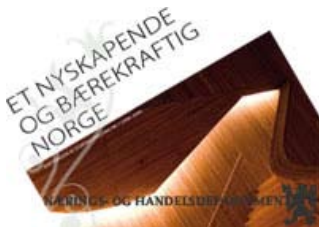
FOKUS PÅ DESIGN I STORTINGSMELDING OM INNOVASJON, SOM BLE LAGT FREM 07.12.2008.

I forhold til regjeringens fremleggelse av Innovasjonsmeldingen høsten 2008 er ND`s forslag til et nytt 3 årig utviklingsprosjekt "Designdrevet Innovasjons Program" ( DIP) tatt til følge og det er som en følge av dette bevilget et særlig tilskudd til programmets første fase i 2009 på 10 mnok, som skal benyttes til gjennomføring av flg. tre delprosjekter: