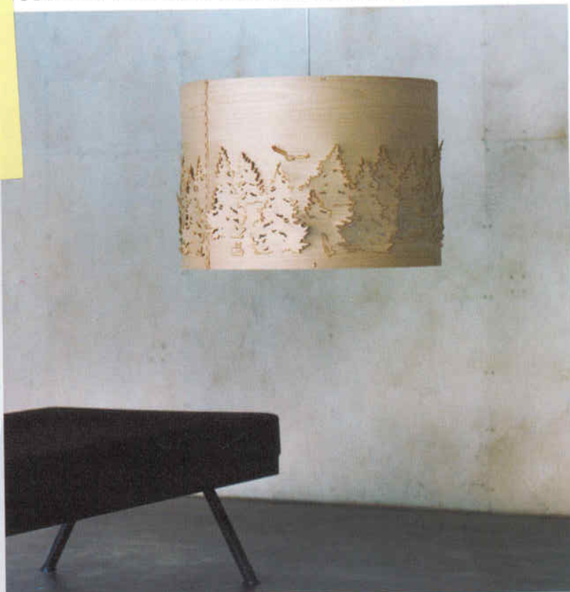
Ovan: Oslo Opera House porslinskollektion, design av Johan Verde, producerat av Porsgrund. Ovan th: Norwegian Forest lamp, design av Cathrine Kullberg. Tv: Lull lamp, design av Marianne Varmo, producerad av Audun Kollstad & Heidi Buene. Nedan: Penguin chair, design av Peter Opsvik, producerad av Varier Furniture. Th: Bordet Daylight Comes Sideways av Daniel Rybakken.